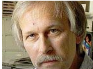
Rolf Gössner

Bremen. Rolf Gössner, Vizepräsident der Internationalen Liga für Menschenrechte, wird nicht länger vom Verfassungsschutz beobachtet. Nach 38-jähriger Überwachung habe das Kölner Bundesamt für Verfassungsschutz (BfV) ihm jetzt mitgeteilt, dass "nach aktuell erfolgter Prüfung" durch Bundesinnenministerium und BfV seine Beobachtung eingestellt worden sei und die Daten gesperrt würden, berichtete der 60-jährige Bremer Anwalt und Publizist am Dienstag. Eine Sprecherin des BfV wollte zu dem Fall keine Stellungnahme abgeben.